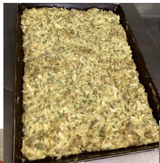
焼きあがったら、カットします。