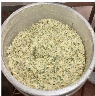
生地を作り、焼き物機で焼きます。

11月に新作献立の「お好み焼き」を実施しました！※学校HPにはカラーで載っています。