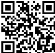
七中サポート隊 (部活動見守り)

おおさわ学園コミュニティ・スクール委員会では、多くの地域の方や保護者の皆様のご協力をいただいております。卒業後も、是非「地域の方のサポート隊」として登録いただき、「七中部活動見守りサポート」や大沢台小、羽沢小の各種サポートにご支援をお願いします。☆登録を希望される学校のQRコードを読み取り、「地域の方項目」で登録手続きをお願いします。